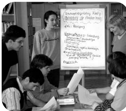
SchülerInnen bereiten den Beteiligungsprozess vor